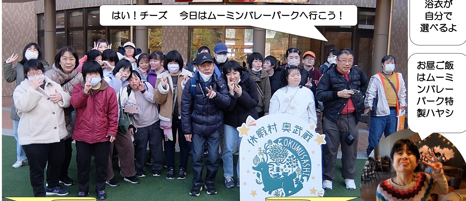
はい！チーズ 今日ムーミンバレーパークへ行こう！