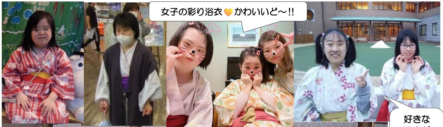
女子の彩り浴衣 ♡かわいいど〜!!