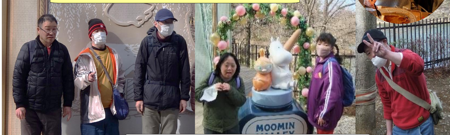
キャラクターがいっぱい！ ムーミンと写真もとれるよ